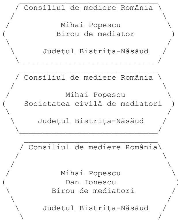
Figura 1Lex : Modelul ștampilei formelor de exercitare a profesiei